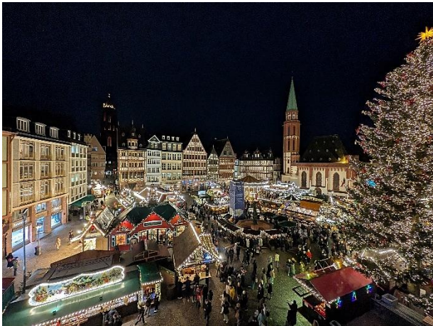
Frankfurter Weihnachtsmarkt 2025

Auch im Jahr 2025 gingen bei den engagierten Elfen und Wichteln der Heinrich Kraft-Stiftung wieder zahlreiche Wunschzettel der Kinder und Jugendlichen ein. Die Wünsche reichten von Kinderfahrrädern und Bluetooth-Partylautsprechern sowie Gutscheinen für Spielwarenhändler bis hin zu den angesagten Drohnen mit Kameras und vielem mehr. Damit alle Wünsche rechtzeitig zu den Weihnachtsfeiern in den Einrichtungen erfüllt werden konnten, wurde mit großem Einsatz gearbeitet.