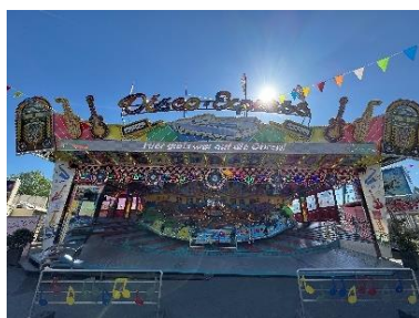
Disco-Express auf der Dippemess 2025