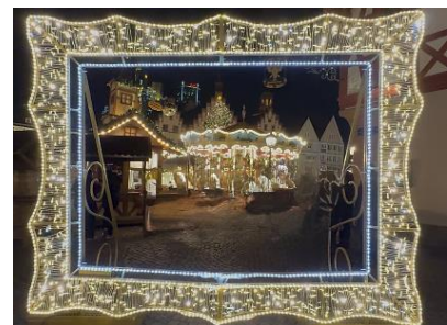
Frankfurter Weihnachtsmarkt 2025

Die große Wertschätzung gegenüber unseren Elfen, Wichteln und dem HKS-Weihnachtsmann zeigte sich auch in diesem Jahr in Form von liebevoll gestalteten Karten, Fotos und selbstgebackenen Plätzchen und unterstrich damit den Erfolg der gesamten Weihnachtsaktion.