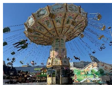
Kettenkarussell auf der Dippemess 2025